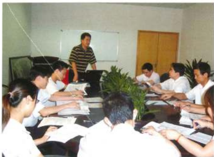
▲公司管理小组正在讨论生产流程改造

2008年金融海啸席卷全球，世界经济遭受重创的背景下，集团分公司深圳市好耐特科技发展有限公司在全公司上下的共同努力下，不仅抵御了金融海啸的强烈影响，而且逆势增长，第一季度取得了良好的经营业绩。