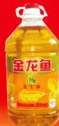
品牌：金龙鱼特香花生油 包装形式：5L