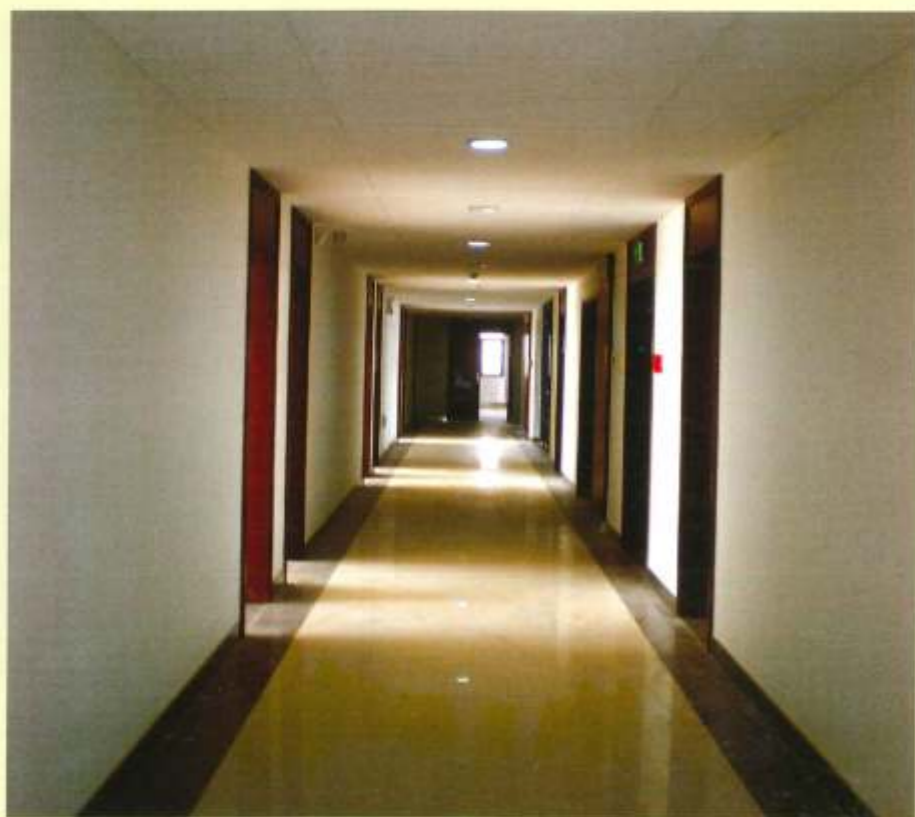
办公室通道 党政大楼正面