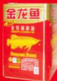
品牌：金龙鱼第二代调和油 包装形式：16L