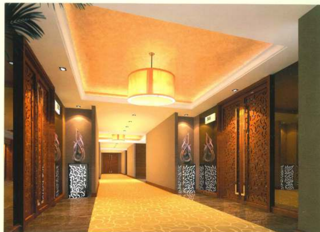
包房 接待厅 酒店大堂 酒店西餐厅 包房走道 包房一