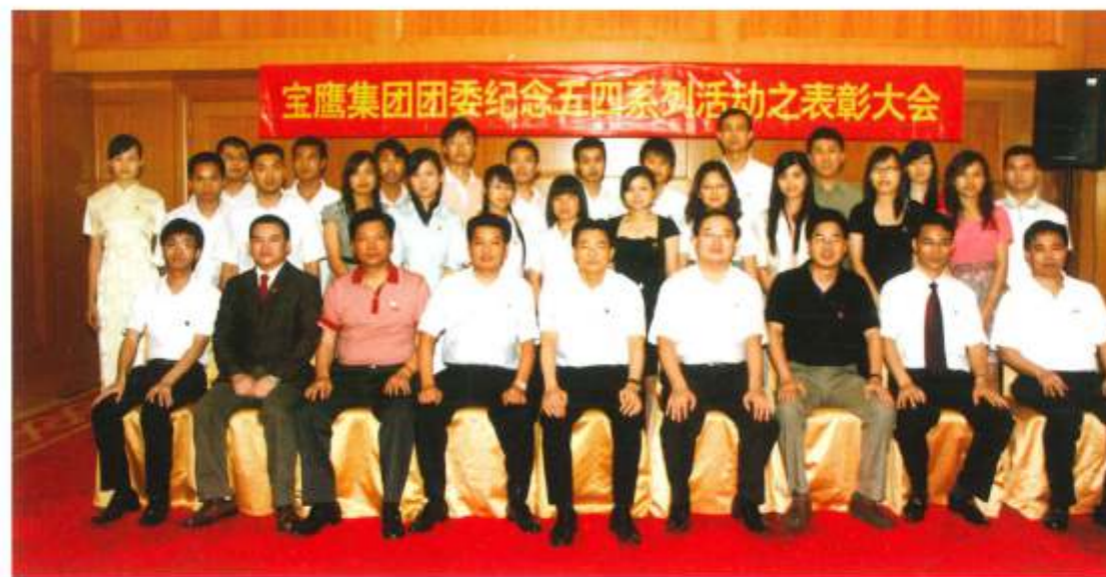
▲出席会议领导与获奖团员青年亲切合影

幕。古少明董事长首先上台致辞，他在致辞中向长期以来重视和关怀宝鹰集团共青团工作的各位领导，向关心和支持宝鹰集团共青团工作的各界人士表示由衷的感谢和崇高的敬意！向在宝鹰集团各条战线奋勇拼搏、努力工作、无私奉献的广大青年员工表示最亲切的问候！他在致辞中说，团委自成立以来，充分发挥团组织模范先锋作用，在提高青年员工思想素质、组建青年员工社团、服务青年员工工作和生活、促进青年员工成长成才、推动集团建设和发展等方面发挥了重要作用、取得了很大成效。当前国际金融危机形势十分严峻，广东是全国受影响最严重的地区之一，我们在这种情况下隆重召开今天这个专属于年青人的会议，有更为特殊的意义。在经济萧条之秋，在发展困难之时，企业更需要一批“有活力、有干劲、有创新”的青年员工；他号召集团青年员工认真学习和领会中共中央政治局委员、广东省委书记汪洋同志《弘扬五四精神，勇当科学发展的时代先锋》的重要讲话精神，务必正确理解汪洋书记对当代青年所寄予的殷切期望。