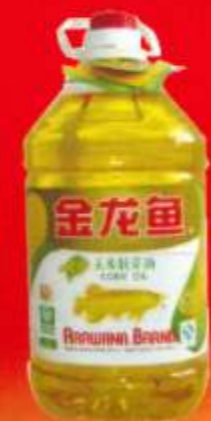
品牌：金龙鱼玉米胚芽油 包装形式：5L