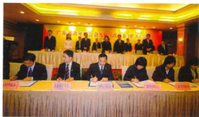
▲ 珠三角地区各地方青年联合会在领导们的见证下签订青联组织合作框架协议