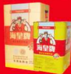
品牌：海皇餐饮专用调和油 包装形式：16L