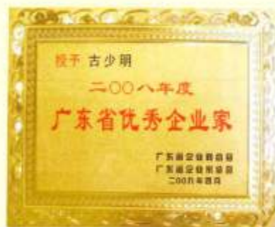
▲ 2008年度广东省优秀企业家奖牌