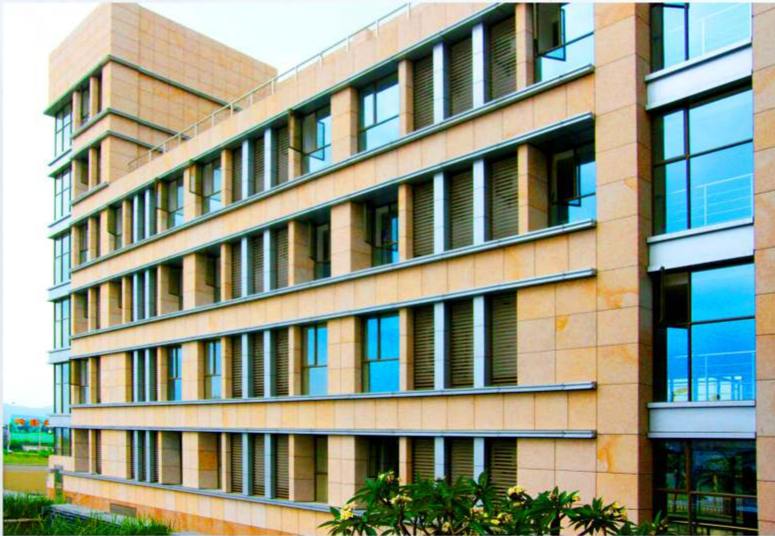
大楼北面百叶及铝板装饰线条