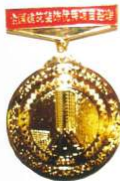
▲全国建筑装饰优秀项目经理奖牌