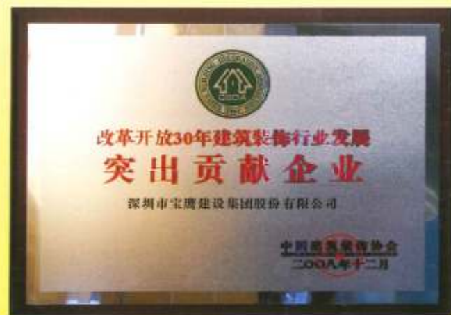
▲ 集团荣获改革开放30年建筑装饰行业发展突出贡献企业荣誉称号

宝鹰集团系中国建筑装饰协会理事单位，广东省企业联合会副会长单位。业务网络遍布全国，规模日臻庞大，已经成立了北京分公司、上海分公司、天津分公司、武汉分公司、江苏分公司、江西分公司、福建龙岩分公司、东莞分公司、广州分公司、新疆办事处、重庆办事处、西安办事处等众多分支机构以及全