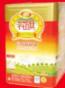
品牌：花旗食用调和油 包装形式：16L