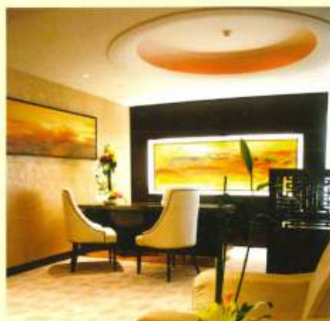
国家会议中心正面 休闲空间