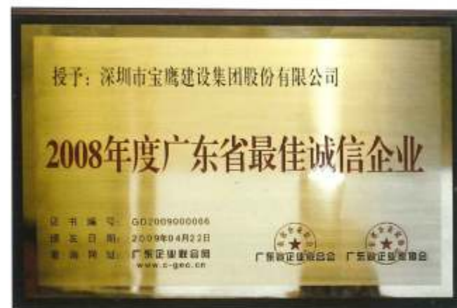
▲ 2008年度广东省最佳诚信企业

号；此次，被评为“2008年度广东省最佳诚信企业”是对我公司诚信经营战略的又一次巨大肯定和鞭策。