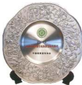
▲2008年全国建筑装饰行业科技创新成果奖盘

据悉，本次中国建筑装饰协会为进一步树立科学技术是第一生产力的思想，促进科技成果尽快转化为生产力，鼓励广大建筑装饰企业的创新精神，使我国建筑装饰行业尽早进入创新型国家的行列，中国建筑装饰协会经研究决定对36个“科技创新成果奖”的企业及个人进行表彰。我公司是本年度少数取得两项以上科技创新成果奖的企业，这也充分证明了我公司鼓励施工工艺和施工技术创新的政策是效果卓著的，我公司将继续鼓励创新、提升水平，争取在建设科技创新成果工程上取得更大的成绩！