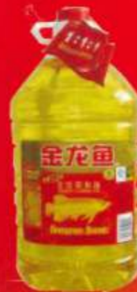
品牌：食用调和油 包装形式：5L