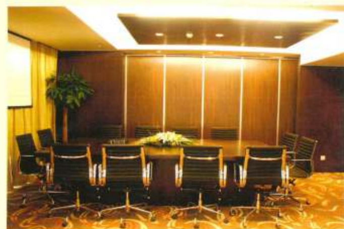
内 通 道 装 饰 国家会议中心[1] 国家会议中心[2] 国家会议中心[3] 国家会议中心[4] 国家会议中心[5] 小会议室