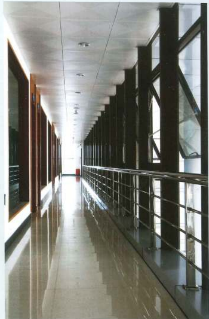
办税大厅 大楼外墙北面