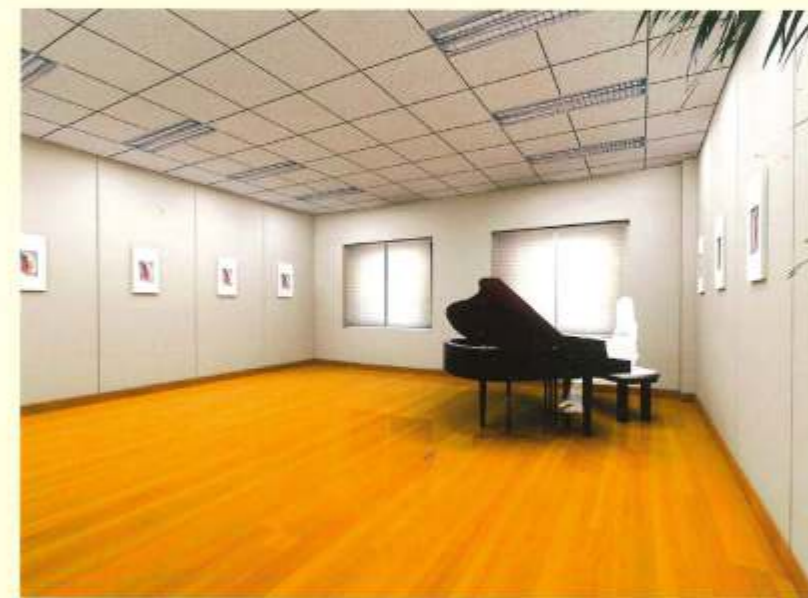
儿童剧场1 | 活动厅 音乐教室 少儿剧场2 | 舞蹈排练 | 舞蹈教室