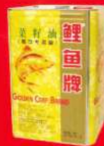
品牌：鲤鱼菜籽油 包装形式：16L