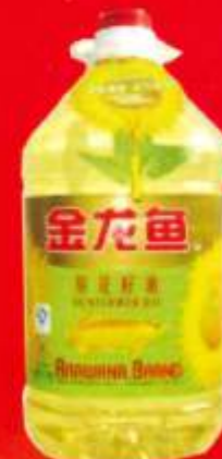
品牌：金龙鱼菜籽油 包装形式：5L